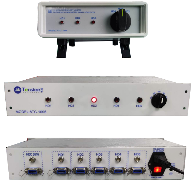
一转五测功机转换开关盒